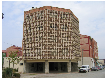
Iglesia del barrio de las Matillas (Miranda)

El 13 de Agosto unos 200 ecuatorianos de Miranda de Ebro celebraron su fiesta en honor de la Virgen del Cisne. Ellos organizaron, prepararon y llevaron adelante la Eucaristía en unión con la co-