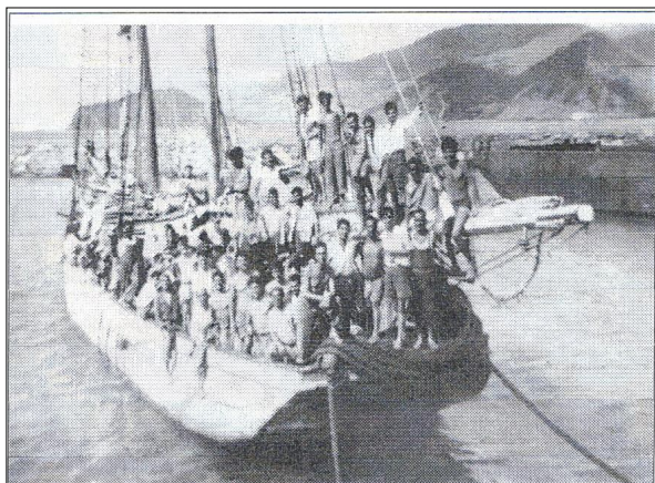
Imagen de los tripulantes de "La Elvira" a su llegada a Puerto de Garupano, Venezuela, en Mayo 1949