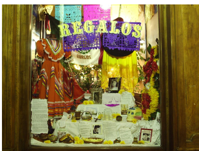
Altar del año pasado, dedicado a Consuelo Velázquez, gran compositora mexicana

Es una tradición muy bella de México por la que veneramos el recuerdo de los fallecidos. Desde tiempos prehistóricos existe la creencia que en el Día de Muertos pueden salir del “más allá” y regresar a esta vida, por lo que les preparamos un Altar de Ofrendas con lo que más les gustaba en vida para recibirlos.