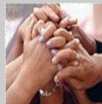
CÁRITAS y las mujeres en contexto de prostitución

Bienvenido sea el asociacionismo inmigrante, la sincera colaboración, la convivencia pacífica y el mutuo enriquecimiento... Es una bocanada de aire fresco en medio de unas circunstancias políticas e internacionales un tanto confusas y convulsas. Nos puede ayudar "a derribar prejuicios y a aumentar la comprensión y la fraternidad con vistas a la unidad de la familia humana", como dijo Juan Pablo II.