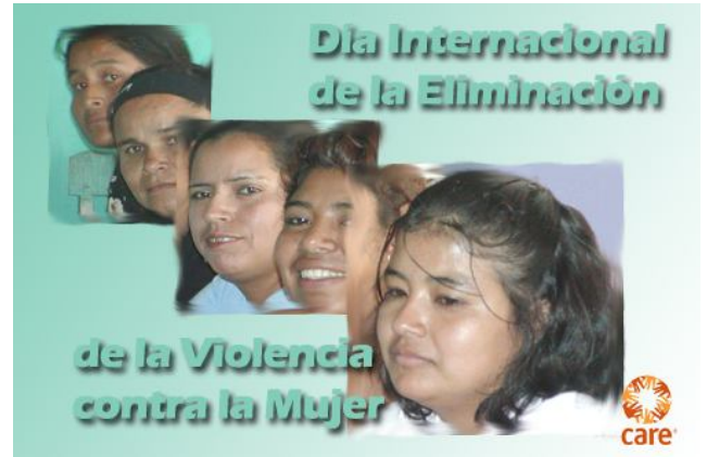
Cartel de una campaña reciente

Sí, se calcula que un millón y medio acuden diariamente al mercado de la prostitución; de éstos, el sesenta por ciento son casados.