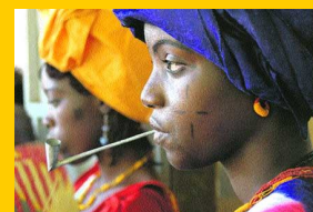
CAYUCOS Buscando una salida