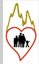
Centro diocesano de ORIENTACIÓN FAMILIAR

¿Por qué será que nos fijamos más en lo diverso que en lo común? ¿Por qué tendemos a considerarnos casi perfectos y superiores a los demás? Las religiones monoteístas (Judaísmo, Cristianismo, Islam) apelamos a un solo Dios y a un origen común de toda la humanidad. Pues... ¡que se note!