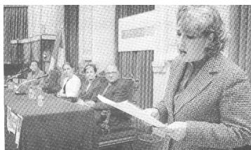
Presentación de "Ven con nosotros"

Últimamente parece que todo va por parejas de dos. Nuestra capital, y en concreto el Teatro Principal, ha acogido en fechas recientes la presentación de dos nuevas asociaciones de inmigrantes.