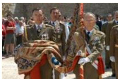
Desfile con el pendón de Las Navas

barrio de las Huelgas y el parque del Parral. Los orígenes de la tradición del Curpillós en Burgos apuntan a la victoria de Alfonso VIII en la batalla de las Navas de Tolosa el 16 de Julio de 1212. Se declaró día festivo en 1953.