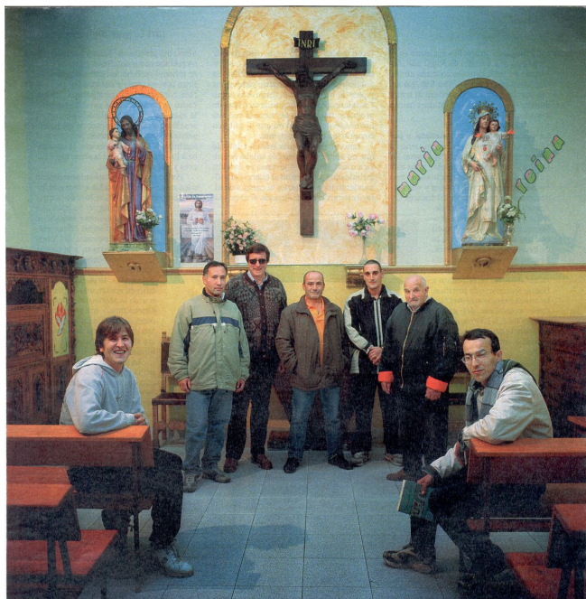
Varios internos de la cárcel de Burgos con el capellán

Un colombiano, desde la cárcel de Burgos