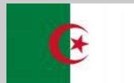
País a país ARGELIA