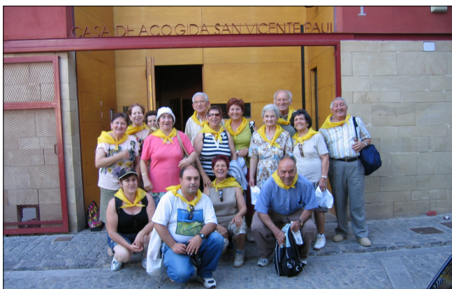
Visita de una comunidad parroquial a la Casa de Acogida

"Fui emigrante y compartiste mi vida" (Mt 25)