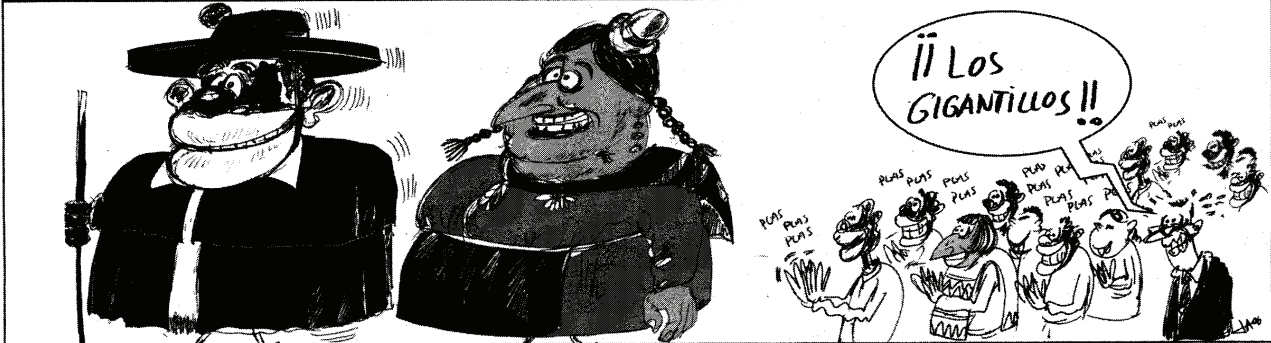
(El Correo de Burgos, 22 de Noviembre de 2007)

CRECE EN 5 AÑOS LA POBLACIÓN DE BURGOS EN 7.400 HABITANTES, DE LOS CUALES 7.145 SON EXTRANJEROS