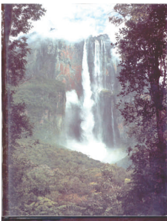
Salto Ángel Icono bizantino

Como símbolos patrios, su pabellón tricolor tiene tres franjas horizontales en amarillo, azul y rojo, con ocho estrellas blancas que destacan en el centro de la franja azul; su escudo de armas, también tricolor, contiene el caballo blanco de Bolívar, las espadas de cada gesta heroica, el olivo y el laurel. Su himno nacional, Gloria al Bravo Pueblo , canta los hechos memorables de las gestas libertarias del pueblo venezolano.