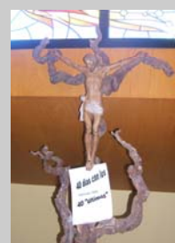
MIRADA CRISTIANA a los inmigrantes

Sólo desde la cercanía, el diálogo, la mutua acogida e integración caerán estos miedos e inquietudes, quizá muy naturales, pero poco racionales.