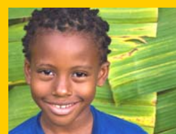
Nos acercamos a la ASOCIACIÓN HECHOS