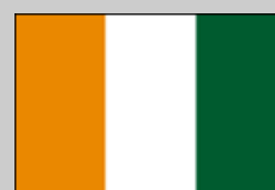
País a país COSTA DE MARFIL