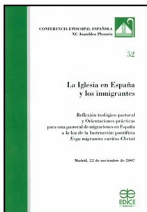
Conferencia Episcopal Española 2007 68 páginas

España 1960: dos amigos, Martín y Marcos, deciden marcharse a Suiza en busca de trabajo. Allí descubrirán una mentalidad muy diferente a la que deberán adaptarse, trabajando como mecánicos en una fábrica y viviendo en un pequeño pueblo industrial. Con la llegada de sus familias se les termina la vida de hombres solteros que llevaban en un país con tanta libertad. Con la muerte del padre de Martín se plantean que lo que habían ido a buscar ya lo han conseguido y es hora de regresar. Para su sorpresa, será más difícil la vuelta que la ida.