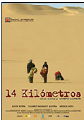
Gerardo Olivares España 2007 95 minutos