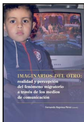
Fernando Represa (coordinador) 2007 150 páginas

Reflexión teológica y pastoral y orientaciones prácticas para una pastoral de migraciones en España. Documento aprobado en la Asamblea Plenaria de los obispos en noviembre de 2007, motivado por la profunda transformación del fenómeno de las migraciones acaecida en España en las últimas décadas, y a la luz de la Instrucción pontificia Erga migrantes caritas Christi , de mayo de 2004.