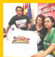
Nos acercamos a BOLIVIANOS Miranda de Ebro