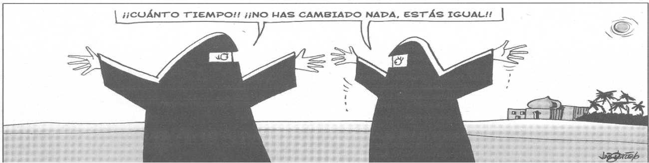
(Diario de Burgos, 8 de Mayo de 2010)