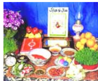
Fiesta de Año Nuevo

La costumbre de esta fiesta es que unos días antes de empezar el año nuevo, la gente hace una limpieza profunda en sus casas y compra ropa nueva. El primer día del nuevo año se ponen encima de un mantel siete objetos que empiezan con la letra "C", como por ejemplo: un pez en una jarra, un espejo, un Corán, unas hierbas que se han plantado unos días antes, ajo, una moneda, unos huevos pintados en forma de cabeza de muñeca, una manzana. El santo llamado Amesha Sepanta protege los 7 elementos de la vida humana, es decir, Fuego, Tierra, Agua, Aire, Plantas, Animales y Humanos, que están representados por estos 7 objetos puestos en la mesa.