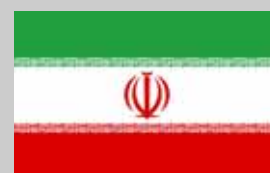
País a país IRÁN