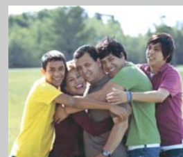
LA FAMILIA, clave de la integración

Hay una parábola del Evangelio que viene muy a cuento de esta situación: “ ¡Siervo malvado! Toda aquella deuda te la perdóné porque me lo rogaste. ¿No debías tú tener también compasión de tu compañero? ” (Mateo 18). Pensemos: ¿cuántos millones de euros se han entregado a los bancos españoles para que no fuéramos supuestamente todos a la quiebra? ¿Cuántos “rescates” sigue habiendo? ¿Y todavía tienen algunos vergüenza para dejar en la calle a unos inquilinos que hasta ahora han pagado, y encima les dicen que deben no sé cuánto más? Sin palabras.