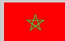
País a país MARRUECOS