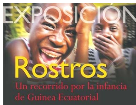
Cartel de una reciente exposición sobre Guinea Ecuatorial realizada en marzo de este año en el Foro Solidario de Caja de Burgos

Pues que la actuación del Gobierno está siendo vergonzosa, y todos los inmigrantes nos sentimos discriminados y disgustados.