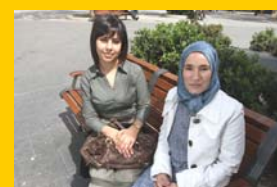
LA MUJER en el Islam y en el Cristianismo