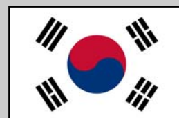
País a país COREA DEL SUR