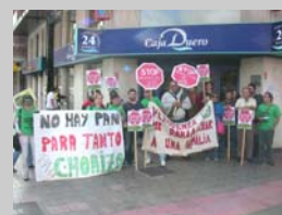
Plataforma de afectados por la HIPOTECA

Diez años en los que hemos visto avances palpables, experimentado alegrías y compartido ilusiones. Diez años intentando superar barreras que, desgraciadamente, vuelven a aparecer y crecen en tiempo de crisis. Diez años para dar gracias por tantas personas que han estado y están traduciendo su fe en un servicio de acogida y acompañamiento, de integración y fraternidad, de dar mucho y recibir más. Qué bueno si este Año de la Fe recién estrenado nos sirviera para recordar una vez más la frase del evangelio según san Mateo: Fui forastero y me acogisteis. Lo que hicisteis con uno de estos, mis hermanos pequeños, conmigo lo hicisteis.