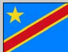
País a país Rep. Dem. del CONGO