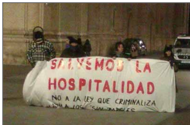
Círculo de Silencio de Zaragoza, 1 de marzo de 2013

En su primer “ángelus” , el nuevo Papa Francisco nos decía que sólo la misericordia nos humaniza: la otioridad, la multiculturalidad, nos enriquecen posibilitando el compartir. Es ridículo criminalizar el principio de humanidad, penalizar la hospitalidad y el altruismo. Todos los seres humanos tienen “el deber de comportarse fraternalmente unos con otros” (artículo 1 de la Declaración Universal de los Derechos Humanos). Permanezcamos atentos para generar y gestionar comportamientos fraternales que pongan barrera al economicismo craso, que en su culto al imposible crecimiento ilimitado, nos fragmenta y hace polvo desde el consumo y la competitividad.