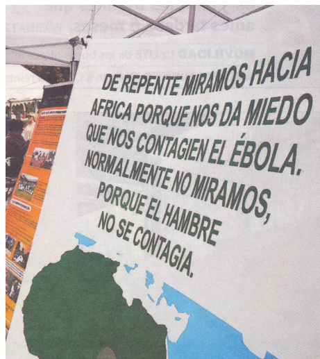
Pancarta presente en la Feria de Participación Ciudadana de Burgos, 21 de septiembre de 2014

“Aparte de la pobreza generalizada, la situación política está empeorando las cosas; hay personas que huyen de los conflictos”