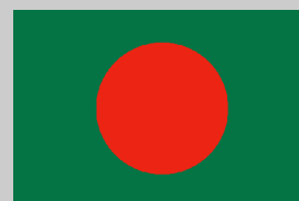
País a país BANGLADESH