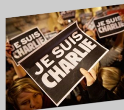
Libertad de expresión y RESPECTO

En este sentido habría que matizar las palabras de los Obispos españoles cuando en su último documento Iglesia servidora de los pobres (nº 9) dicen: “Los inmigrantes son los pobres entre los pobres”. Está bien que nos hagan ver el drama de las migraciones forzosas, o de no tener papeles. Pero completemos esa mirada con lo que los mismos Obispos dicen un poco más arriba: “Ha llegado la hora de reconocer la aportación que han hecho los inmigrantes a nuestra sociedad. Hemos de valorar su riqueza”.