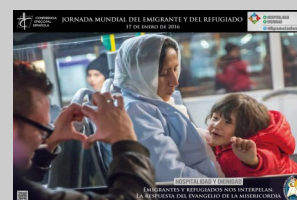
Emigrantes y refugiados NOS INTERPELAN

Los católicos iniciamos el Año de la Misericordia. Los musulmanes rezan todos los días a Dios “el Misericordioso”. Muchos no creyentes tratan de llevar adelante los valores de “libertad, igualdad y fraternidad”. Es mucho más lo que nos une que lo que nos separa. Y de ello quiere ser testigo esta humilde revista.