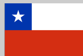
País a país CHILE