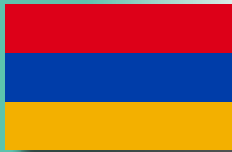
País a país: ARMENIA