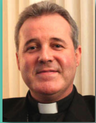
El arzobispo invita al JUBILEO