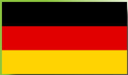
País a país: ALEMANIA