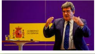
La reforma de EXTRANJERÍA